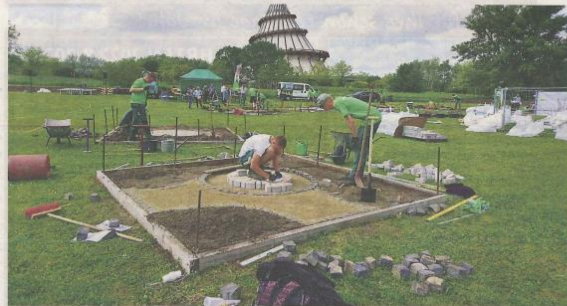
Im Elbauenpark wird am Sonnabend Sachsens-Anhalts bester Landschaftsgärtner-Azubi ermittelt.

„Unser Wettbewerb im Elbauenpark wird deutlich machen, welche Fähigkeiten unsere Landschaftsgärtner im Land haben, um anspruchsvolle und beeindruckende Garten- und Parkanlagen zu gestalten“, so Janet Gassdorf. Die Siegerehrung ist für 17.30 Uhr vorgesehen.